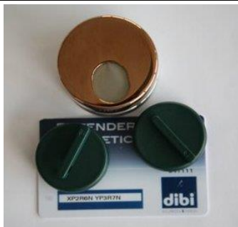
Kit defender "Key Protector" avec clés et carte de propriété