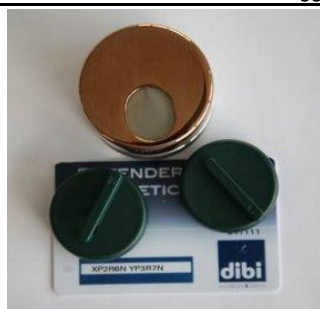
Kit defender "Key Protector" con chiavi e card