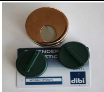
Kit defender "Key Protector" con chiavi e card