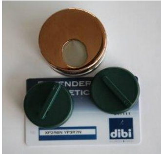
Kit defender "Key Protector" avec clés et carte de propriété