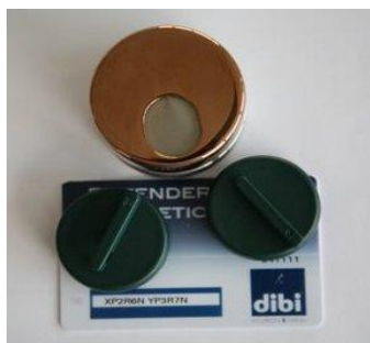
Kit defender "Key Protector" avec clés et carte de propriété