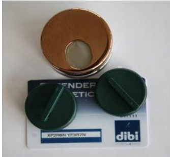
Kit defender "Key Protector" avec clés et carte de propriété